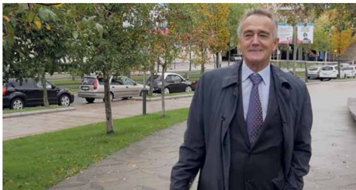
Antón Pradera. Presidente de CIE Automotive.